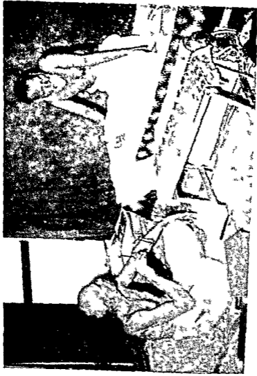
दुराण साह चि पूव तयारी भीपा [अच्युतमाथी] बरोबर चर्चा वस्ताना